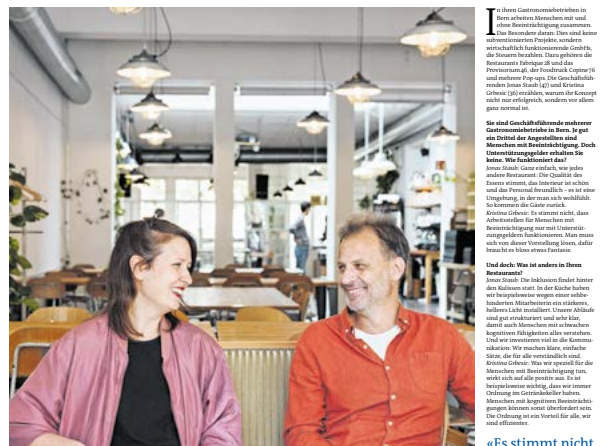
«Es stimmt nicht,